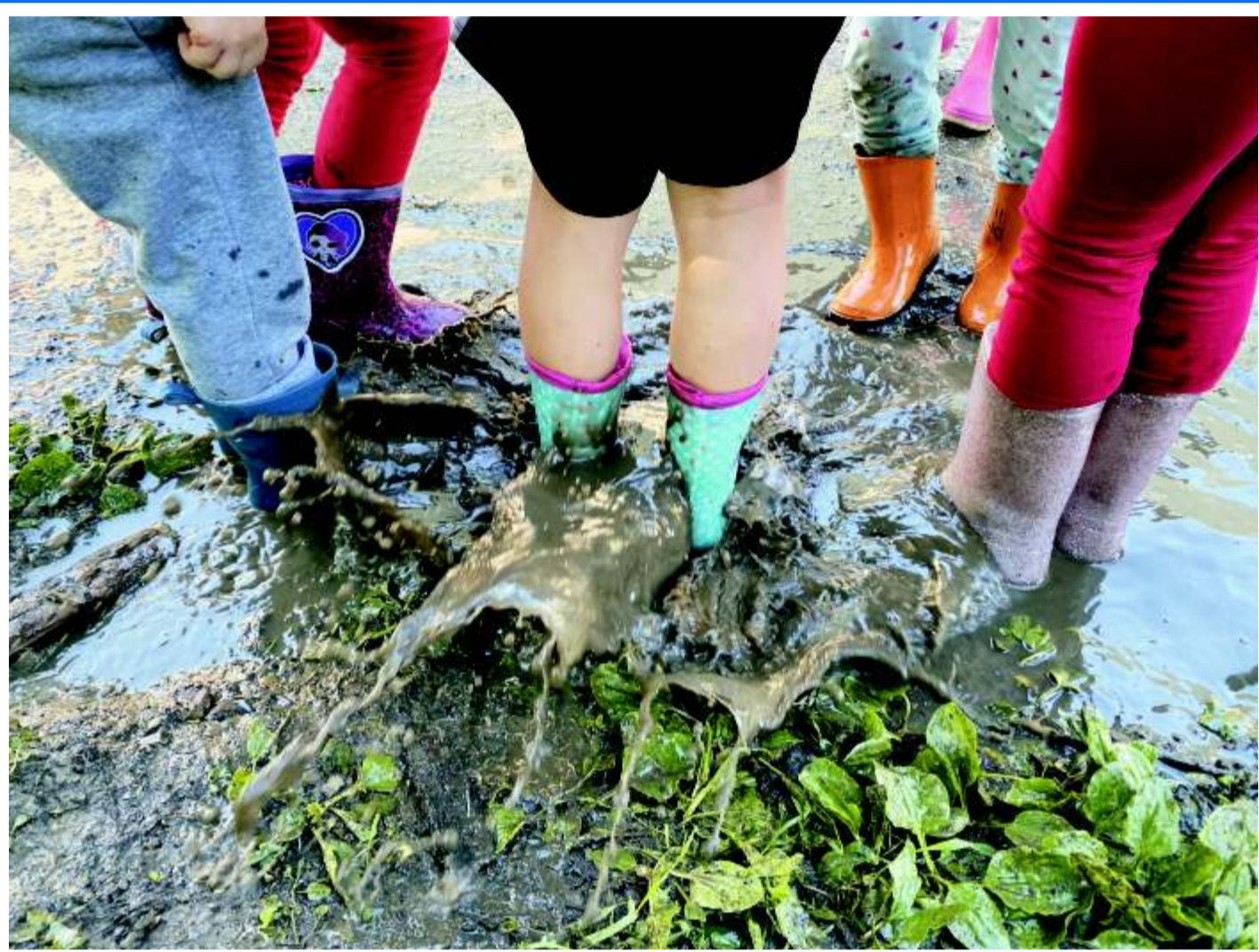
DIRITTO DI SPORCARI